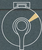
Visibility window Ventana de visibilidad

Como su nombre indica, Ghost es un dispensador fijado en un riel oculto, lo que da la impresión de que el producto está levitando.