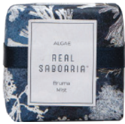
Savon 50g - 1.76oz