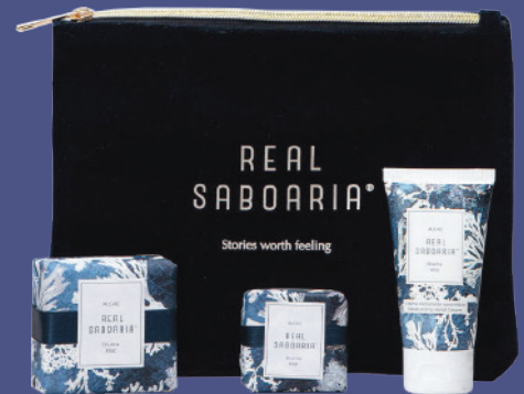
Coffret Savon 50g - 1.76oz Savon 120g - 4.22oz Crème de Mains 50ml - 1.69fl.oz