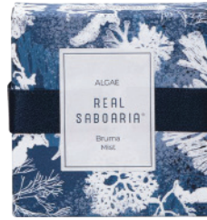
Shampooing Solide 80g - 2.82oz