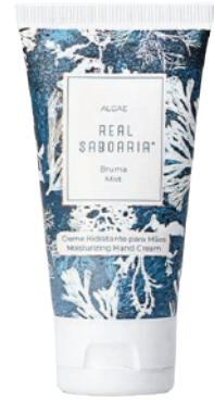
Crème de Mains 50ml - 1.69fl.oz