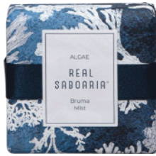
Savon 120g - 4.22oz