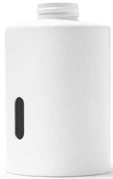
PARTIE 1 - HAUTE