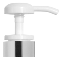
Pompe blanche brillante Bague argent brillante