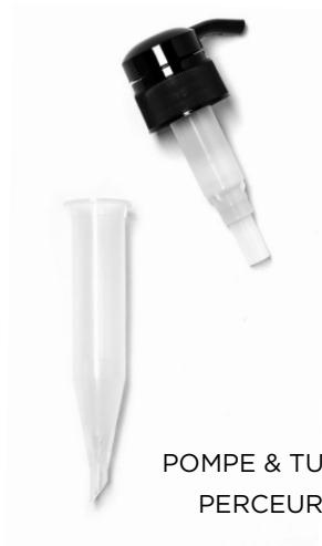
POMPE & TUBE PERCEUR