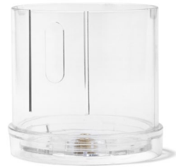
PARTIE 2 - BASSE