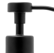
Pompe noire mate Bague noire mate