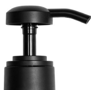
Pompe noire mate Bague noire mate