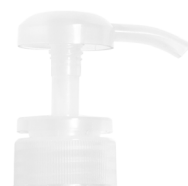
Pompe translucide brillante Bague translucide brillante