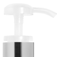
Pompe translucide brillante Bague argent brillante