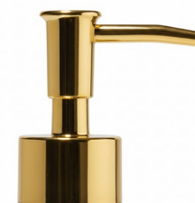
Pompe or brillante Bague or brillante