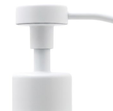
Pompe blanche mate Bague blanche mate