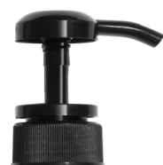
Pompe noire brillante Bague noire brillante