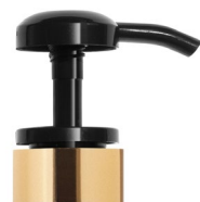
Pompe noire brillante Bague or brillante