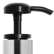
Pompe noire brillante Bague argent brillante