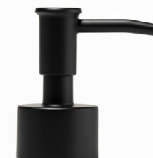
Pompe noire mate Bague noire mate