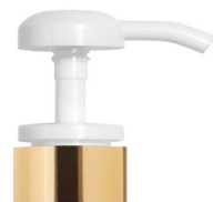
Pompe blanche brillante Bague or brillante