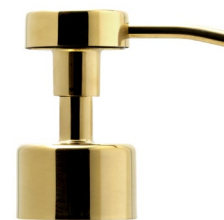
Pompe or brillante Bague or brillante