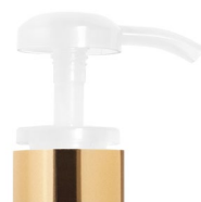
Pompe translucide brillante Bague or brillante