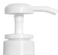
Pompe blanche brillante Bague blanche brillante