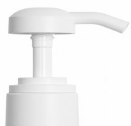
Pompe blanche mate Bague blanche mate